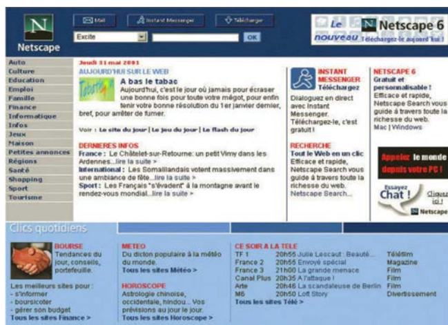
Figure 3 — Dès l'entrée sur ce site, l'internaute trouve la réponse à des questions, comme : Quelles sont les dernières nouvelles ? Qu'y a-t-il ce soir à la télé ? La page d'accueil lui fournit l'information directement sans l'obliger à entrer dans le site.

Un autre objectif de la page d'accueil : expliquer à l'utilisateur comment naviguer dans le site. Pour cela, la présentation et les libellés des rubriques doivent être semblables à ceux utilisés dans le reste du site. De cette manière, l'utilisateur peut généraliser ce qu'il apprend sur la page d'accueil à l'ensemble du site. (Voir fig3)